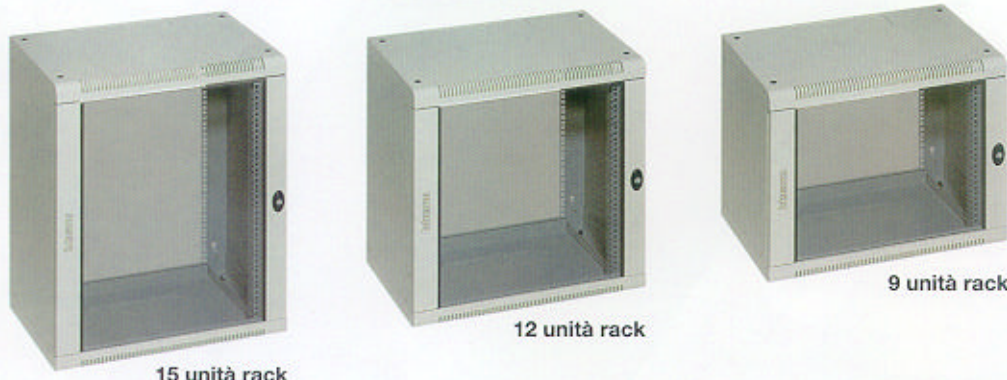
15 unità rack

Entrambe le tipologie dei nuovi contenitori Btnet sono dotate di un'ampia gamma di accessori, in grado di soddisfare ogni esigenza installativa.